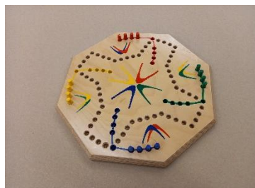
Dog Spiel für 4 Personen Birken-Sperrholz, lackiert, Ø 32 cm, inkl. Karten und Anleitung | Fr. 38.–