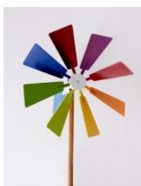
Windrad H 200 cm, T 60 cm, Ø Rad ca. 60 cm mit Kugellager | Fr. 120.–