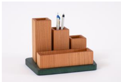
Schreibzeughalter div. Massivholz und Farben | Fr. 30.–