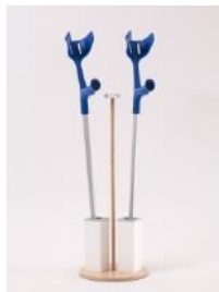
Gehstockhalter Ø 28 cm, H 72 cm, Ø Loch 5 cm Fr. 48.00