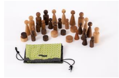
Therapiefiguren Set 24-teilig mit Stoffbeutel | Fr. 290.– Auch Einzelverkauf möglich (vgl. separater Flyer)