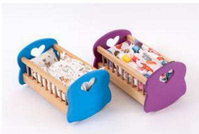
Puppenbett mit Inhalt div. Farben L 44 cm, B 26 cm, H 23 cm | Fr. 58.–