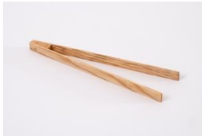
Grillzange L 30 cm | Fr. 6.–