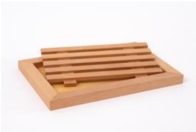
Brotbrett Buchenholz mit herausnehmbarem Gitter L 35 cm, B 24 cm | Fr. 35.–