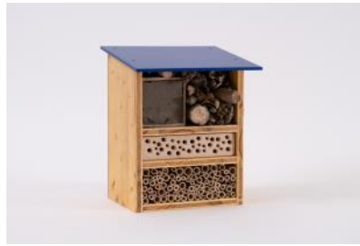
Wildbienenhotel H 32 cm, B 24 cm, T 26 cm | Fr. 45.–