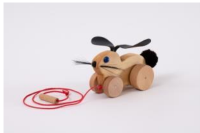
Hoppelhase Fr. 34.–