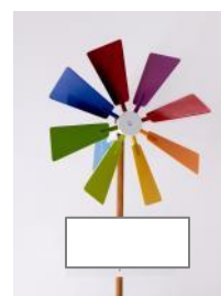
Geburtstafeln für Windräder Tafel weiss grundiert, 40x20 cm Fr. 10.–