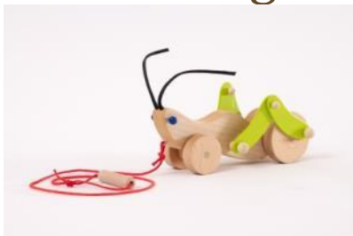
Heugümper Fr. 34.–