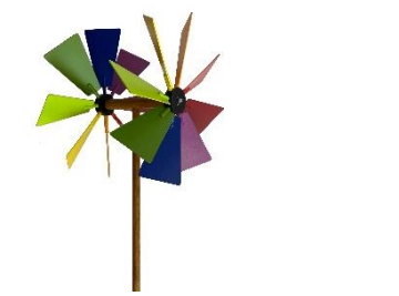
Windrad doppelt H 200 cm, T 60 cm, Ø Rad ca. 60 cm mit Kugellager | Fr. 140.–