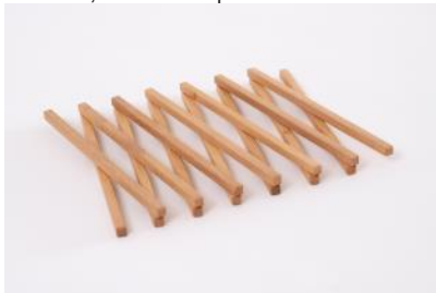
Pfannenuntersetzer Schere L 24 - 50 cm, B 9 cm | Fr. 19.–