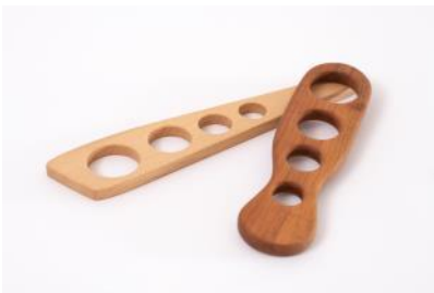
Spaghettiportionierer / Kochkelle Buchenholz | Fr. 12.–