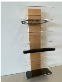
Brillen- und Smartphonehalter Plexiglas/Massivholz, zum Aufstellen oder Wandmontage, H 44cm, B 15cm, H 80cm | Fr. 35.–