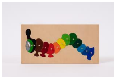
Puzzle für Kleinkinder L 35 cm, B 37cm | Fr. 18.–