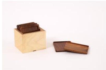
Raclette-Pfännchenuntersetzer 8-teilig | Fr. 48.–