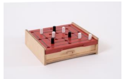
Mühle mit Schiebedeckel div. Farben, L 16 cm, B 15 cm, H 4.5 cm | Fr. 25.–