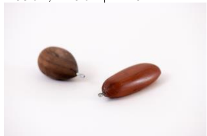
Schlüsselanhänger Massivholz, div. Formen | Fr. 9.–