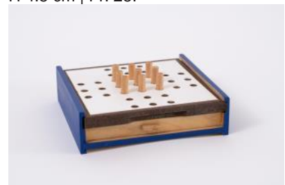
Solitär mit Schiebedeckel div. Farben, L 16 cm, B 15 cm, H 4.5 cm | Fr. 25.–