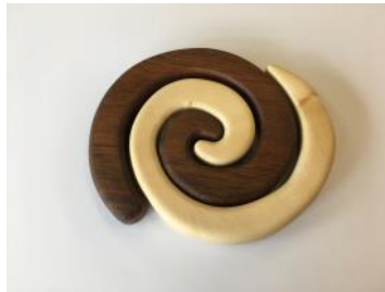
Pfannenuntersetzer Spirale Ø ca. 24 cm | Fr. 34.–