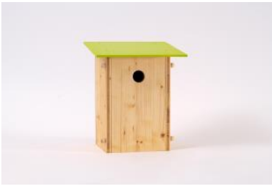
Vogel-Nistkasten H 32 cm, B 24 cm, T 20 cm, Ø Loch 3.5 cm | Fr. 35.–