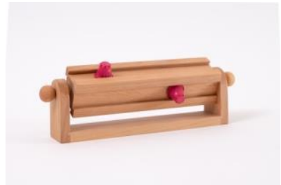
Kaffeekapselhalter Nespresso Zum Aufstellen oder Wandmontage B 35cm, H 11cm, T 7 cm | Fr. 48.–